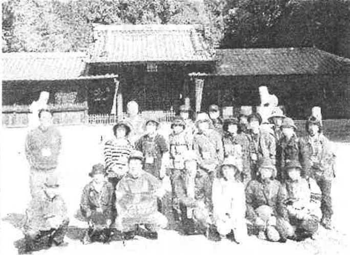
渡刈糟目春日大社で