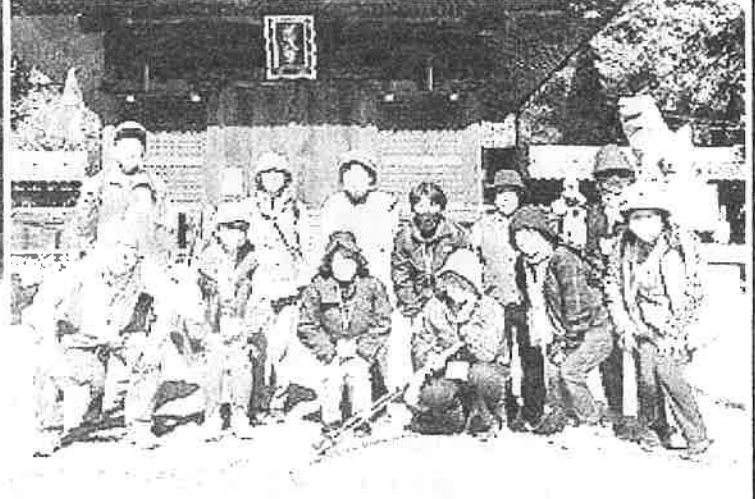
鴛鴨若宮八幡社で