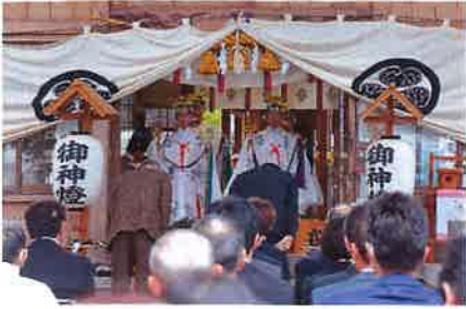
式典は巫女舞の中、粛々と