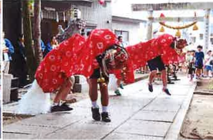
元気よく獅子舞奉納