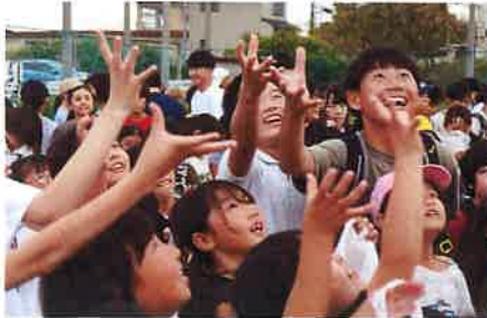
笑顔・笑顔の餅投げ