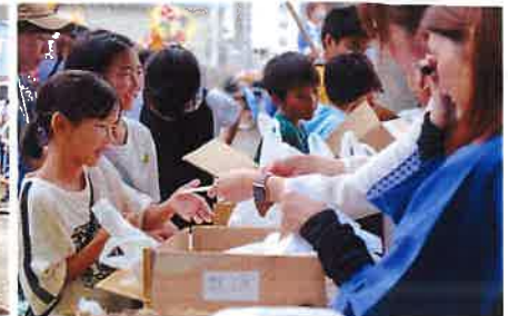
神輿巡行が終わった後も笑顔