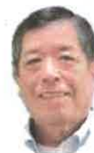
第10期 富重副会長 (大林町)

10期の地域会議が動き始めてすぐに「南海トラフ地震臨時情報」が発令されて、本当に大災害が起きるんじゃないかと怖かったよね。