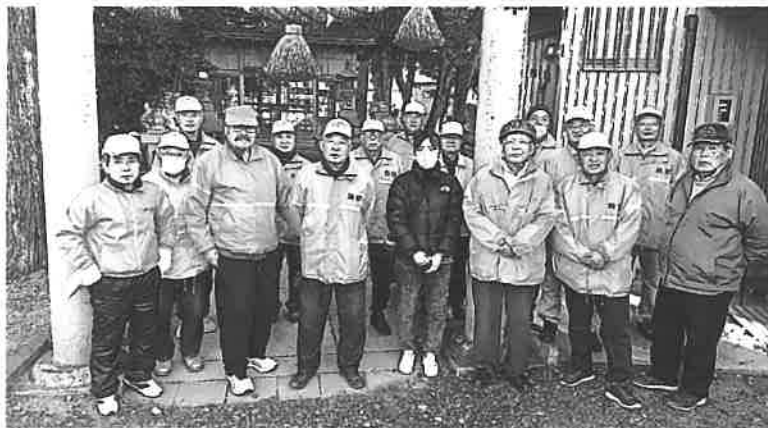
弁慶パトロール隊員一同より