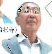
市川委員(永覚新町)

末野原地域は、物資や支援が届き始めるまでの期間を 地域力で乗り切る 地域を目指したいよね。