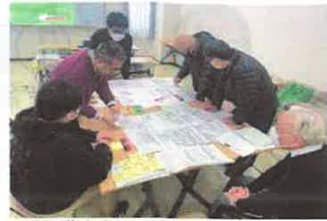
地域会議委員がHUGを体験している様子

避難所運営って言われても、イメージがわからないね。「避難所運営ゲーム(HUG)」を使って避難所運営を体験。