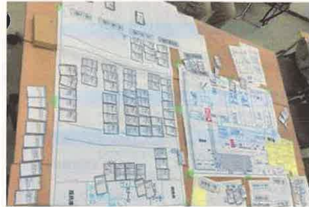
避難所運営ゲーム(HUG)とは大地震発生後の「避難所」を疑似体験するゲーム

各自治区では防災訓練はあるけど、実際の避難時は、4つの避難所に複数の自治区区民が集まってくるのに、もっと広域の、末野原地域での取組みってないよね？