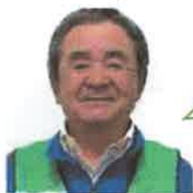
大内委員(豊栄町一区)