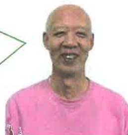
種池委員(御幸本町・大林町)

自分でできることは自分でやる、避難所が混乱しないよう できる範囲で協力しあって 避難所生活を送ることが大事ですね